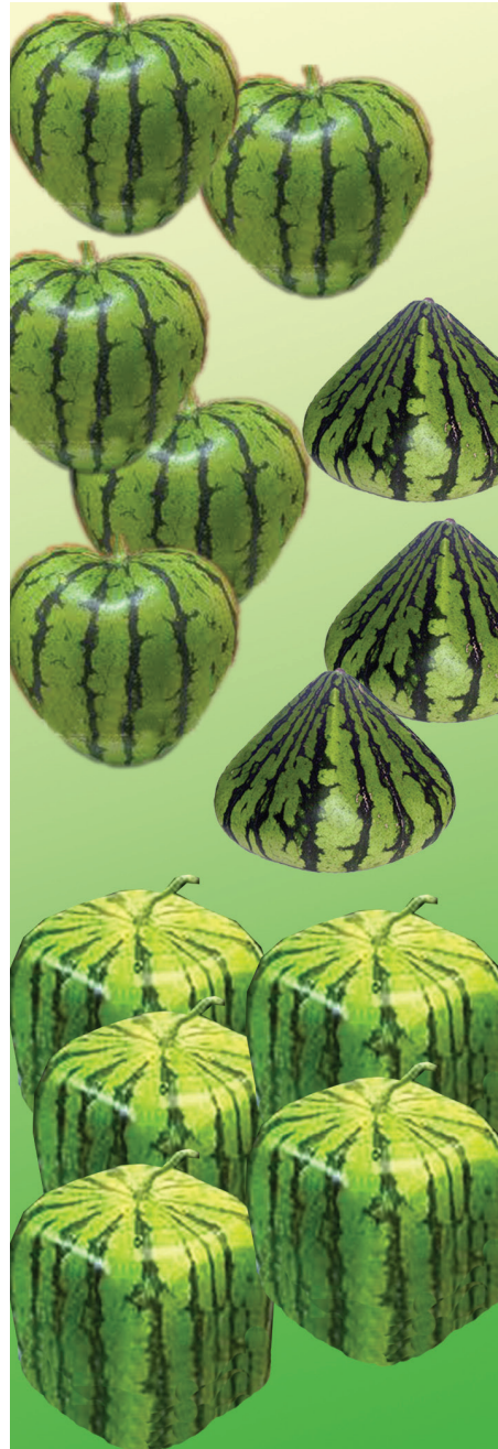
රූපය 1.5 නිර්මාණශීලීත්වයට හාජන වූ කොමඩු

පුද්ගලයන්ගේ නිර්මාණශීලීත්වයට මූල්‍යමය ත්‍යාග ලබා දීම, උපහාර ලබා දීම සහ අගය කිරීම ආදී ක්‍රම මගින් දිරිමත් වේ.