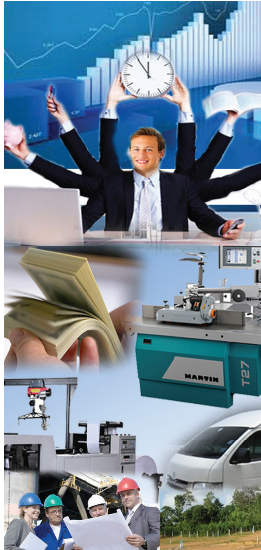
රූපය 1.1 නිෂ්පාදන සාධක