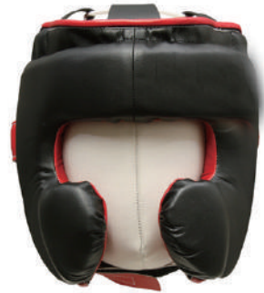
6.6 රූපය - බොක්සිං ක්‍රීඩාව සඳහා ආරක්ෂිත මුහුණු ආවරණ පැලඳීම

ක්‍රීඩාවේ දී විවිධ අනතුරු සිදු විය හැකි ය. ක්‍රීඩාව සිදු කරන ආකාරය, ක්‍රීඩාවේ දී භාවිත කරන උපකරණ යනාදිය මෙයට හේතු විය හැකි ය. නීතිය අනුව භාවිත කළ හැකි උපකරණවල සම්මතයක් දක්වා ඇති බැවින් තමාට අවශ්‍ය පරිදි උපකරණ භාවිත කළ නොහැකි ය. එසේ ම නීතිය මගින් ක්‍රීඩාවේ නිරත විය යුතු ආකාරය ද දක්වා ඇත.