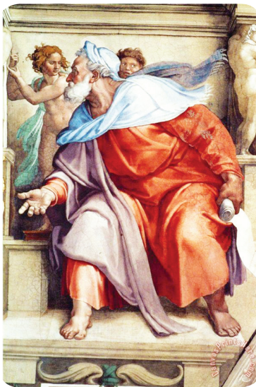
3.3 රූපය - එසකියෙල් දිවැසිවරයා

මා නුඹ යවන සියල්ලන් වෙත යන්න. මා නුඹට අණ කරන සියල්ල පවසන්න. .... මෙන්න මාගේ පණිවිඩය, නුඹේ මුඛයෙහි තැබීමි. උදුරන්නට හා කඩා දමන්නටත්, නැති කරන්නට හා හෙළා දමන්නටත්, ගොඩනගන්නට හා සිටුවන්නටත් ජාතීන් හා රාජ්‍යයන් කෙරෙහි නුඹට බලය දී අද මම නුඹ පත් කළෙමි” කියා ය. ජෙරමියා දිවැසිවරයා මෙන් අපත් අපේ දුබලකම් තුළ දෙවියන් වහන්සේ අපට බාර දෙන වගකීම් හා යුතුකම් ඉටු කිරීමට ස්වාමීන් වහන්සේගෙන් බලවත් විය යුතු වෙමු.