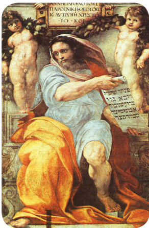
3.1 රූපය - යෙසායා දිවැසිවරයා

ප්‍රධාන හා සුළු දිවැසිවරුන් ලෙස වර්ගීකරණයේ පදනම වන්නේ, එක් එක් දිවැසිවරුන්ගේ විශාලත්වය යි.