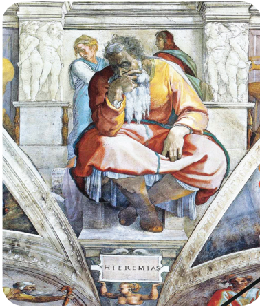
3.2 රූපය - ජෙරමියා දිවැසිවරයා