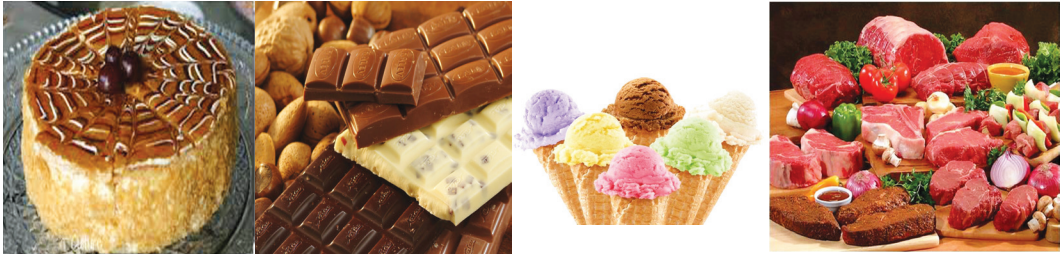
6.1 රූපය - පැණි රස ආහාර හා මාංශමය ආහාර

ඉහත රූපවල දැක්වෙන ආහාර දෙස බලන්න. ඒවා හඳුනා ගන්න. කේක්, අයිස්ක්‍රීම්, වොක්ලට්, මස් වර්ග යනාදිය ඒ අතර වේ. එම ආහාර කෙතරම් රසවත් ද? කෙතරම් ගුණ දයක ද? එහෙත් කේක්, අයිස් ක්‍රීම් වැනි පැණි රස කෑම දියවැඩියා රෝගියකුට කෙතරම් අගුණ ද? හරක් මස්, උගුරු මස්, සොසේජස් වැනි ආහාර හෘද රෝගියෙකුට කෙතරම් අගුණ ද? එම රෝගීන්ගේ රෝගී තත්ත්ව එම ආහාර අනුභවය තව දුරටත් උත්සන්න කරයි. මරණය තවත් කඩිනම් කරයි.