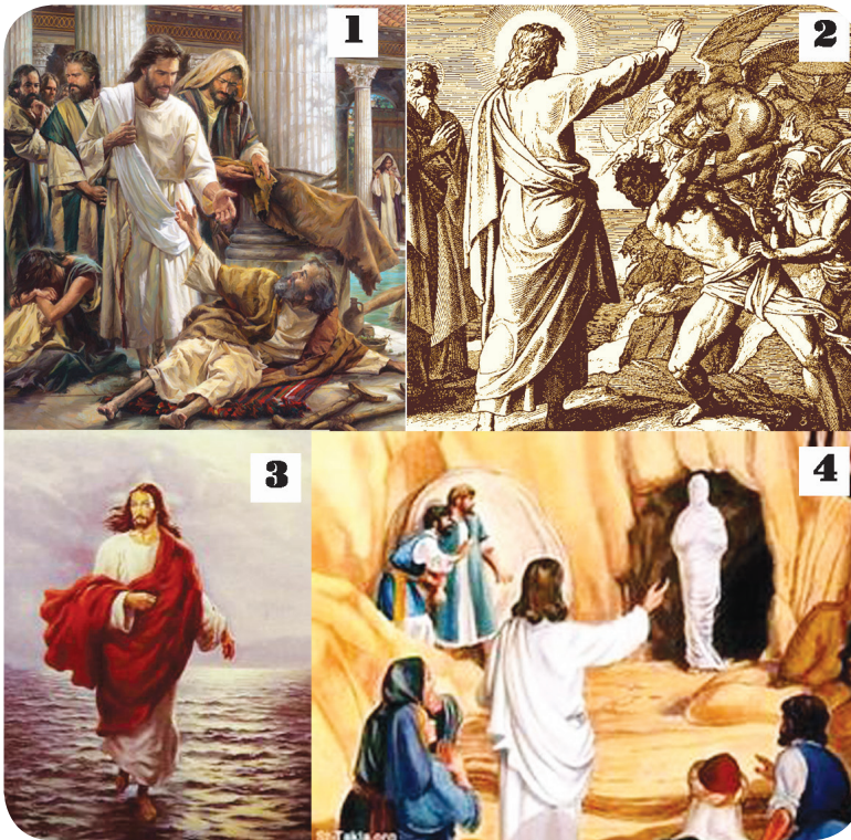
10.2 රූපය - ජේසුස් වහන්සේ සිදු කළ ප්‍රතිහාර්ය වර්ග හතරට නිදසුන්