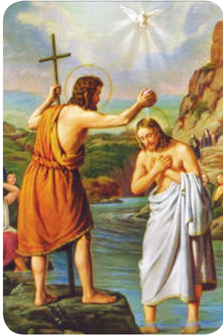
10.1 රූපය - ජේසුස් වහන්සේ ප්‍රසාද ස්නාපනය ලැබූ අවස්ථාව

ජේසුස් වහන්සේගේ ප්‍රසිද්ධ ජීවිතය ආරම්භ වන්නේ දූත මෙහෙවර ආරම්භ වන්නේත් උන්වහන්සේගේ ප්‍රසාද ස්නාපනයෙනි. එම අවස්ථාවේ දී ශුද්ධ ත්‍රිත්වය ම අනාවරණය විය. ජේසුස් වහන්සේගේ දේව පුත්‍රභාවයට ප්‍රකාශ විය. එය ශුද්ධ වූ ලූක් තුමා මෙසේ වාර්තා කරයි: