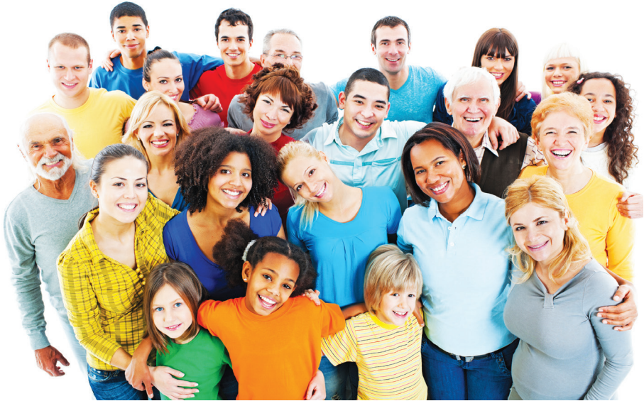
11.1 රූපය - "දයා ප්‍රේමය ඇති තැන දෙවියෝ වැඩ වසනු ඇත"

රාජ්‍යයක් යනු යම් දේශ සීමාවක් තුළ යම් ප්‍රතිපත්තියක් හෝ ව්‍යවස්ථා මාලාවක් තුළ පාලකයන් හා පාලිතයින් අතර සම්මුතියෙන් සිදු වන පාලනයකි. දේව රාජ්‍යය මෙවැනි ලොකික රාජ්‍යයක් නොවේ. දේව රාජ්‍යයට දේශ සීමා නැත. එසේ නම් දෙවියන් වහන්සේගේ රාජ්‍යය;