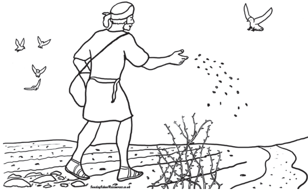
11.2 රූපය - වපුරන්නාගේ උපමාව