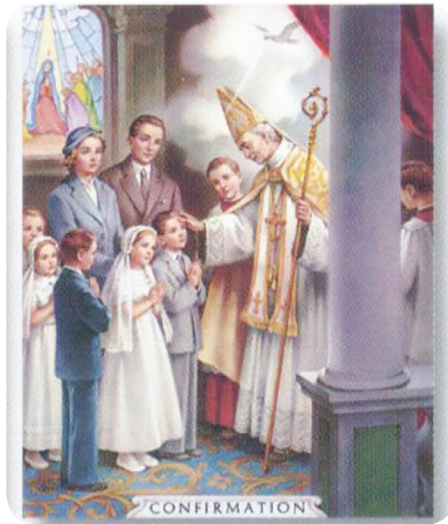
12.2 රූපය - රදගුරුතුමා අභිවාද්ධ ආලේපය දනය කිරීම