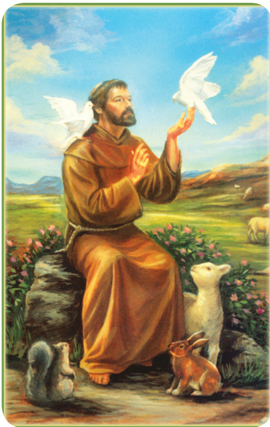
19.1 රූපය - අසීසියේ ශුද්ධ වූ ග්‍රැන්සිස් මුනිතුමා