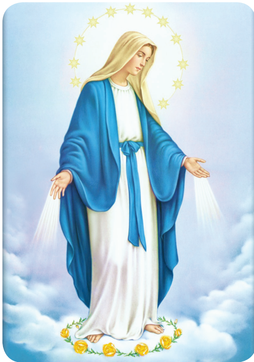
23.1 රූපය - මරියතුමියගේ ස්වර්ගාරෝපණය

තව ද මරියෝග්‍යතාවන්ගේ මෙලොව ජීවිතය අවසානයේ දී දෙවියන් වහන්සේ ඕනොමන් ව ආත්ම ශරීර පිටින් ස්වර්ගයට ඔසවා ගත් සේක. ජේසුස් වහන්සේ ව මරණයෙන් උත්ථාන කරලීම මඟින් දෙවියන් වහන්සේ සැමට ම පොරොන්දු වූ උත්ථානයෙහි ඕනොමන් පංගුකාර වූයේ ඒ ආකාරයෙනි. මේ අනුව මරියෝග්‍යතාවන්ගේ ස්වර්ගාරෝපණය ගැන විශ්වාසය ප්‍රකාශ කිරීමේ දී අප කරන්නේ අපේ ම උත්ථානය හා සදාතන ජීවිතය ගැන අපේ විශ්වාසය ප්‍රකාශ කිරීම ය. ජේසුස් වහන්සේ අපෝස්තුලුවරුන්ට දුන් පහත පොරොන්දුවෙන් එය පැහැදිලි ය: