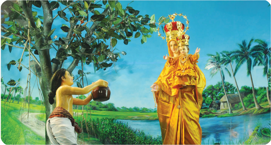
23.4 රූපය - දේව මාතාවන් වේලක්කන්නි නුවර දී දර්ශනය වීම

ජේසුස් වහන්සේ වඩාගත් මරිය තුමිය කිරි වෙළඳාමේ යන පිරිමි දරුවකුට පොකුණක් අසල දර්ශනය වූයේ 16වන සියවසේ දී ය. එතුමිය එම දරුවාගෙන් කිරි ඉල්ලා සිටියේ අතේ සිටි දරුවාට පෙවීමට ය. එම ඉල්ලීම ඉටු කළ දරුවා කිරි විකුණන ස්ථානයට ගොස් සමාව ඉල්ලුවේ ප්‍රමාදය සහ කිරි අඩු නිසා ය. එහෙත් බඳුනේ කිරි අඩු නොවිණි. එබැවින් කිරි මිල දී ගත් තැනැත්තා ඒ දරුවා සමඟ පොකුණ ළඟට නැවත පැමිණි විට එතුමිය ඒ දෙදෙනාට ම නැවත දර්ශනය වූවා ය. පසු ව වේලක්කන්නි යන එම ග්‍රාමයේ නැවත දර්ශනය වූ අතර දරුවකුගේ කොරය ද සුව කළා ය.