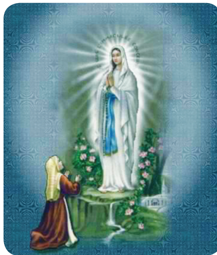
23.1 රූපය - දේව මාතාවන් ලූර්දු නුවර දර්ශනය වීම