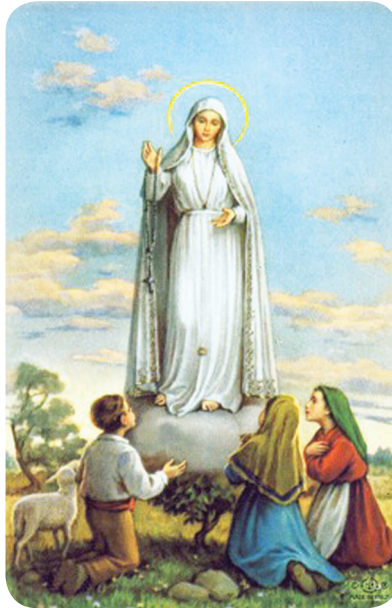
23.1 රූපය - දේව මාතාවන් පාතිමා නුවර දර්ශනය වීම

ක්‍රි.ව. 1917 මැයි මස 13වන දින සිට ඔක්තෝබර් මස 13වන දින දක්වා කාලය තුළ අවස්ථා ගණනාවක දී ප්‍රන්සිස්කෝ, ජසින්තා හා ලුසී යන තිදෙනාට පෘතුගාලයේ පාතිමා නුවර දී දේව මාතාවන් දර්ශනය වූවා ය. ඕක් ගසක ආලෝක ධාරාවක් මැද ජපමාලය අතැති ව එතුමිය දර්ශනය වී ලෝකවාසි පව්කරුවන්ගේ සිත් හැරීම සඳහා ජපමාලය උච්චාරණය කරන්නැයි ඉල්ලා සිටියා ය.