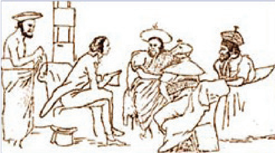
රූපය 2.6 ජෝන් ඩොයිලි උඩරට ප්‍රභූන් සමග

ජෝන් ඩොයිලි උඩරට රදල ප්‍රභූන් සමග රහසිගත සබඳතා පවත්වා ගනිමින් ඔවුන් ඉංග්‍රීසීන්ට පක්ෂපාතී කර ගැනීමට කැප වීමෙන් කටයුතු කළේ ය. එසේ ම වෙළෙන්දන් සාස්තරකරුවන් වැනි විවිධ වෙස්ගත් වරපුරුෂයන් උඩරට ට යවමින් රාජධානියේ අභ්‍යන්තර කටයුතු ගැන සියලු තොරතුරු රැස් කිරීමට ඔහු කටයුතු කර ඇත. මේ නිසා උඩරට රාජධානියේ අභ්‍යන්තර ආරක්ෂක කටයුතු පිළිබඳ වෙනත් කිසිදු යුරෝපීයෙකු නොදත් තොරතුරු රැසක් අනාවරණය කර ගැනීමට ඩොයිලිට හැකියාව ලැබුණි. මේචලන්ඩ් හා ඩොයිලි විසින් ගොඩනගන ලද වාසිදයක තත්ත්වය ප්‍රයෝජනයට ගෙන උඩරට යටත් කිරීමේ ඉදිරි පියවර තබන ලද්දේ මේචලන්ඩ්ට පසු ආණ්ඩුකාර තනතුරට පත්ව ආ රොබට් බ්‍රවුන්රිග් විසිනි.