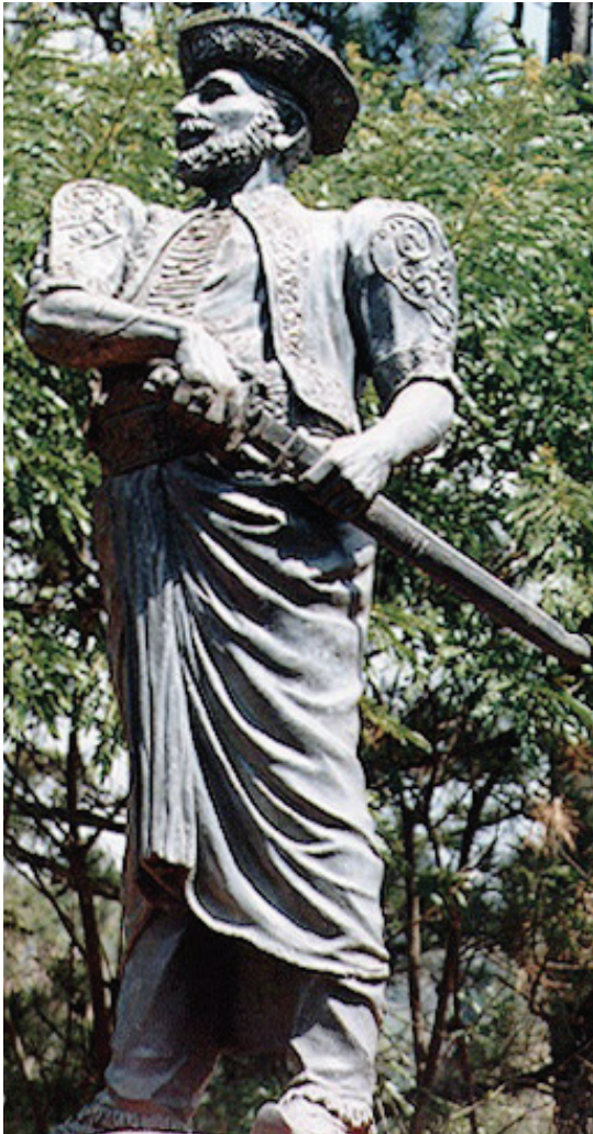
රූපය 2.10 කැප්පෙට්පොළ දිසාව

සටන මර්දනය කිරීමේ දී ඉංග්‍රීසීන් අනුගමනය කළේ ඉතා දරදඬු ප්‍රතිපත්තියකි. 1818 වර්ෂයේ පෙබරවාරි මාසයේ දී ආණ්ඩුකාරවරයා උඩරට ප්‍රදේශවලට යුද්ධ නීතිය ප්‍රකාශයට පත් කළේ ය. මුහුදුබඩ ප්‍රදේශවල සිටි ඉංග්‍රීසි හමුදාව පවා උඩරටට කැඳවිණ. සටන මර්දනයට ඉංග්‍රීසීන් අනුගමනය කළේ බිම් පාළු ප්‍රතිපත්තියකි. ගම්බිම් ගිනි තැබීම, වැසියන්ගේ සම්පත් විනාශ කිරීම හැකි තරම් පිරිසක් අත් අඩංගුවට ගෙන යුද්ධ නීතිය අනුව දඬුවම් කිරීම එකල සුලභ ලක්ෂණයක් විය. ඉංග්‍රීසීන්ගේ දැඩි මර්දනය හමුවේ දීර්ඝ කාලීන සටනක් ගෙන යාමට උඩරටියන්ට හැකියාව නො ලැබුණි. මේ නිසා සටනේ නායකයන් රැසක් ම අත් අඩංගුවට ගැනීමට ඉංග්‍රීසීන්ට හැකියාව ලැබුණි. මත්තමගොඩ, කොබ්බෑකඩුව, දඹවිත්ත වැනි දිසාවන්වරු ද ගලගෙදර මොහොට්ටාල, කතරගම බස්නායක නිලමේ, බූටුවේ රටේ රාළ, ඇහැලේපොළ අධිකාරම් වැනි නායකයන් ද එසේ අත් අඩංගුවට පත් වූවන් කිහිපදෙනෙකි.