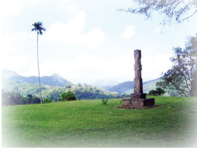
රූපය 2.7 මැද මහනුවර පිහිටි ශ්‍රී වික්‍රම රාජසිංහ රජු අත්අඩංගුවට ගත් ස්ථානයේ තනවා ඇති ස්මාරකය