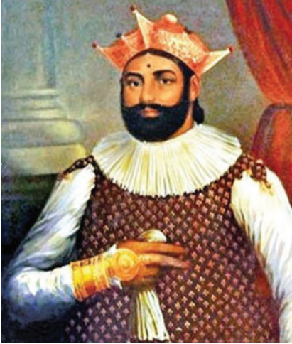
රූපය 2.4 ශ්‍රී වික්‍රම රාජසිංහ රජතුමා

ඉංග්‍රීසිහු මෙරට මුහුදුබඩ ප්‍රදේශවල බලය පිහිටු වීමෙන් පසුව වැඩි කල් නොගොස් උඩරට රාජ්‍ය කෙරෙහි ද තම අවධානය යොමු කළහ. පෙඩරික් නෝර්ත් ආණ්ඩුකාරවරයාගේ ප්‍රතිපත්තිය මෙහි දී විශේෂයෙන් කැපී පෙනේ. නෝර්ත් ආණ්ඩුකාරවරයා මුල් කාලයේ දී තමන්ට වාසි දයක ගිවිසුමකට උඩරට රජු එකඟ කරවා ගැනීමට උත්සාහ කළේ ය. ඒ අනුව 1800 වර්ෂයේ මාර්තු මස සෙන්පති මැක්ඩෝවල්ගේ නායකත්වයෙන් උඩරට ට දූත පිරිසක් යැවීමට නෝර්ත් කටයුතු යෙදී ය. හමුදා හටයන් 1164ක් හා කාල තුවක්කු 8ක් ද සහිත මෙම දූත ගමනේ අරමුණ වූයේ ඉංග්‍රීසින්ගේ යුද්ධ ශක්තිය පෙන්වා තමන්ට වාසි දයක ගිවිසුමකට රජු කැමති කරවා ගැනීම ය. එහෙත් විශාල හමුදාවක් උඩරටට ඇතුළු කර ගැනීම මෙන් ම කාල තුවක්කු