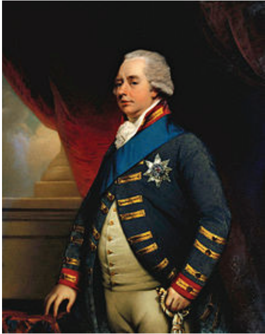
රූපය 2.1 ඕලන්ද පාලක පස්වන විලියම්

ස්ටැට්හෝල්ඩරයා එංගලන්තයේ කිව් මාලිගයේ සිට එවූ බැවින් එය කිව් ලිපිය වශයෙන් ද හැඳින්වේ. ලංකාවේ ලන්දේසීන් සතු ප්‍රදේශ ප්‍රංශවරුන් අතට පත් වීම වලක්වා ගැනීම පිණිස එම ප්‍රදේශවලට ඉංග්‍රීසි හමුදාව ඇතුළු කර ගත යුතු යැයි එම ලිපියේ සඳහන් විය. 1795 වර්ෂයේ පෙබරවාරි මස මෙරට ලන්දේසි ආණ්ඩුකාර ආන් එංගල්බෙක් වෙත එකී ලිපිය ලැබුණි. එහෙත් ලිපියේ සඳහන් පරිදි තම බලකොටු තුළට ඉංග්‍රීසි හමුදාව ඇතුළු කර ගැනීමට මෙම ලන්දේසි ආණ්ඩුකාරවරයා මැලි විය. මේ නිසා 1795 අගෝස්තු මාසයේ දී ඉංග්‍රීසීන් විසින් ලන්දේසීන් සතු වූ ත්‍රිකුණාමලයට පහර දෙන ලදී. ඉංග්‍රීසි ප්‍රහාර හමුවේ ලන්දේසිහු කොන්දේසි විරහිත ව යටත් වූහ.