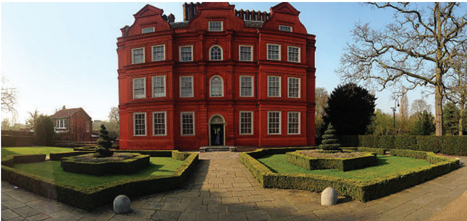
රූපය 2.2 එංගලන්තයේ කිව් මාලිගාව