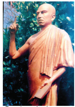
පූජ්‍ය මිගෙට්ටුවන්තේ ගුණානන්ද හිමි

මෙම විවාද මාලාව අතුරින් පානදුරා වාදයට ජාත්‍යන්තර ප්‍රසිද්ධියක් ලැබුණි. එම වාදයේ දී බෞද්ධ පක්ෂය වෙනුවෙන් වාද කළ පූජ්‍ය මිගෙට්ටුවන්තේ ගුණානන්ද හිමියන් හා ක්‍රිස්තියානි පක්ෂය අතර ඇති වූ කතා ඇතුළත් පොතක් කියවීමෙන් පැහැදුණු හෙන්රි ස්ටීල් ඕල්කොට්තුමා පසුව ලංකාවට පැමිණියේ ය.