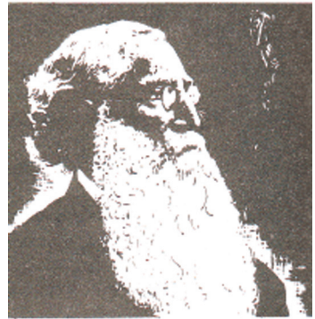
හෙන්රි ස්ටීල් ඕල්කොට්තුමා

ඕල්කොට්තුමාගේ මග පෙන්වීම යටතේ 1880 වර්ෂයේ ජුනි මස දී කොළඹ පරම විඥනාර්ථ සමාගම පිහිටුවිය. එය ගිහි පැවිදි දෙපක්ෂය එක ම වේදිකාවකට කැඳවන පොදු සංවිධානයක් විය. අනතුරු ව එහි ශාඛා ගාල්ල, නුවර, රත්නපුර වැනි ප්‍රධාන නගර කිහිපයක ම පිහිටුවිය. මෙම සංවිධානයේ ප්‍රධාන අරමුණක් වූයේ බෞද්ධ ශිෂ්‍යයන් සඳහා බෞද්ධ පාසල් පිහිටුවීම යි. ඒ සඳහා ඕල්කොට්තුමාගේ මග පෙන්වීමෙන් බෞද්ධ පාසල් අරමුදලක් පිහිටුවන ලදී. මෙම අරමුදලට ආධාර එකතු කිරීමට ඕල්කොට්තුමා හික්සන් වහන්සේලා සමග ගමන් ගම සංචාරය කිරීම නිසා පාසල් පිහිටුවීම පිළිබඳ බෞද්ධයන් තුළ බලවත් උනන්දුවක් ඇති විය. බෞද්ධ පාසල් පිහිටුවීමේ ව්‍යාපාරයේ දී පෙරමුණ ගෙන ක්‍රියා කළ ගිහි පැවිදි පිරිසෙන් කිහිප දෙනෙකුගේ නම් පහත දැක්වේ.