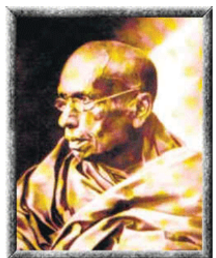
පූජ්‍ය හික්කඩුවේ ශ්‍රී සුමංගල හිමි