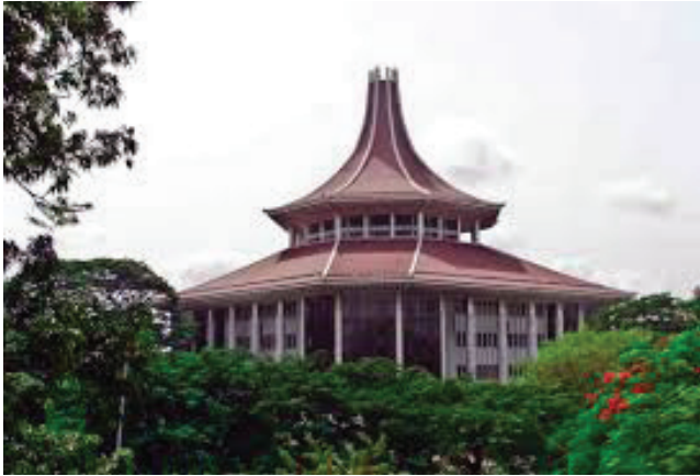
රූපය 6.5 ශ්‍රේණිධායකරණය

අධිකරණයේ ස්වාධීනත්වය රැකෙන පරිදි කටයුතු කිරීමට හා විනිශ්චයකාරවරුන්ගේ අපක්ෂාතීත්වය රැක ගැනීම සඳහා අධිකරණ සේවා කොමිෂන් සභාවක් පිහිටුවා ඇත. අග්‍රවිනිශ්චයකාරතුමා එහි සභාපතිත්වය දරන අතර ශ්‍රේණිධායකරණයේ තව විනිසුරුවෝ දෙදෙනෙක් ද එහි සාමාජිකත්වය දරති. මහාධිකරණයේ විනිශ්චයකරුවන්ගේ ස්ථානමාරු කිරීමේ බලය, අධිකරණ