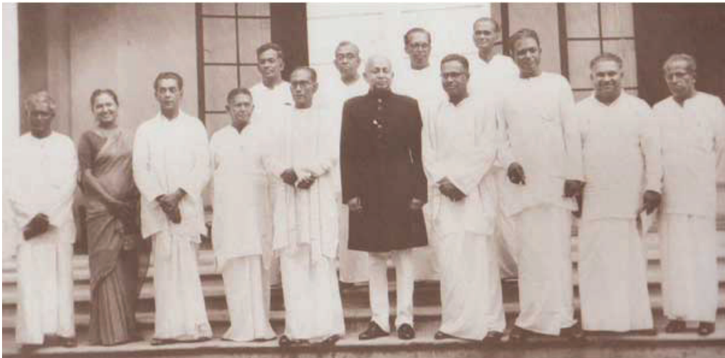
රූපය 6.2 බණ්ඩාරනායක මහතාගේ කැබිනට් මණ්ඩලය

මහජන එක්සත් පෙරමුණේ ජයග්‍රහණයත් සමඟ එස්. ඩබ්ලිව්. ආර්. ඩී බණ්ඩාරනායක මහතා අගමැති තනතුරට පත් විය. එතුමා අගමැති ධුරය දැරූ කාලය මෙරට ඉතිහාසයේ කැපී පෙනෙන අවධියකි. එම කාලයේ දී අනුගමනය කළ ප්‍රතිපත්ති හා හඳුන්වා දුන් ප්‍රතිසංස්කරණ කිහිපයක් පහත දැක්වේ.