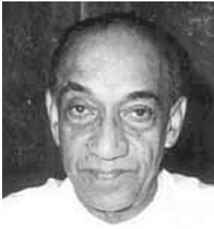
රූපය 2.4 ජේ.ආර්.ජයවර්ධන මහතා

1977 වර්ෂයේ ජූලි මාසයේ පැවති මැතිවරණයෙන් ජාතික රාජ්‍ය සභාවේ මන්ත්‍රී ආසන 168න් 140ක් ම දිනා ගැනීමට එක්සත් ජාතික පක්ෂය සමත් විය මෙම මැතිවරණයෙන් ද්‍රවිඩ එක්සත් විමුක්ති පෙරමුණට ආසන 18ක් ලැබුණු අතර ශ්‍රී ලංකා නිදහස් පක්ෂයට ලබා ගත හැකි වූ ආසන සංඛ්‍යාව 08ක් විය. ඊට අමතරව ලංකා කම්කරු සංගමයට එක් ආසනයක් හා ස්වාධීන මන්ත්‍රීවරයකුට එක් ආසනයක් ලැබුණි. මෙසේ එක්සත් ජාතික පක්ෂයට තුනෙන් දෙකකටත් වැඩි බහුතර ආසන ගණනක් ලැබුණු බැවින් එහි නායක ජේ. ආර්. ජයවර්ධන මහතා කාලයක සිට අපේක්ෂා කළ පරිදි විධායක ජනාධිපති ධුරය සහිත ආණ්ඩුක්‍රම ව්‍යවස්ථාවක් සම්පාදනය කිරීමට අවස්ථාව ලැබුණි. 1978 වර්ෂයේ සිට එම නව ආණ්ඩුක්‍රම ව්‍යවස්ථාව ක්‍රියාත්මක විය.