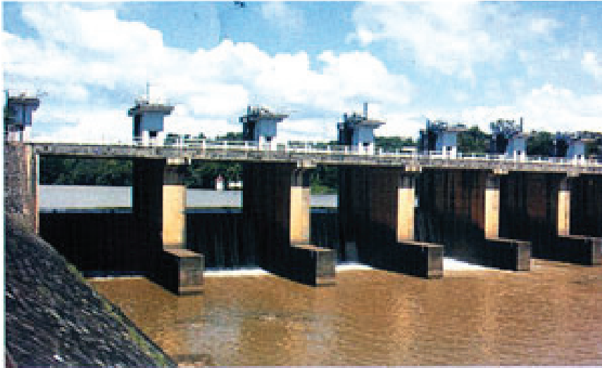
රූපය 6.6 පොල්ගොල්ල අමුණ

ඉතිරි අදියර වශයෙන් තවත් ජලාශ කිහිපයක්, අමුණු හා ඇළ මාර්ග රැසක් ද ඉදි කළ යුතු ව තිබිණි. එහෙත් එම කටයුතු වසර 30 ක් ඇතුළත සම්පූර්ණ කිරීමට මුල දී සැලසුම් කෙරුණි.