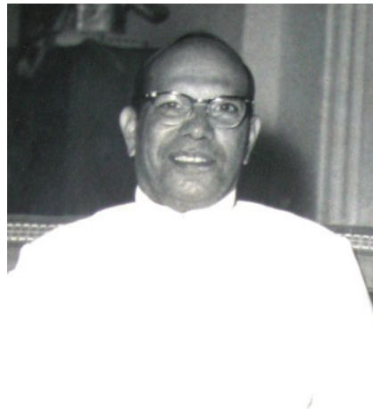
රූපය 6.3 ශ්‍රී ලංකාවේ ප්‍රථම නාමික විධායක ජනාධිපති විලියම් ගොපල්ලව

සෝල්බරි ව්‍යවස්ථාව යටතේ පැවති අග්‍රාණ්ඩුකාර තනතුර වෙනුවට නව ව්‍යවස්ථාවෙන් නාමික විධායක ජනාධිපති තනතුර හඳුන්වා දුන්නේ ය. ජනාධිපතිවරයා පත් කිරීමේ බලය අගමැතිවරයාට හිමි විය එතෙක් පැවති ආණ්ඩුක්‍රමය යටතේ අග්‍රාණ්ඩුකාරවරයාට හිමි වූ බලතල නව ව්‍යවස්ථාවෙන් ජනාධිපතිවරයාට ලැබුණි එවකට අග්‍රාණ්ඩුකාරවරයා වශයෙන් කටයුතු කළ විලියම් ගොපල්ලව මහතා මෙරට ප්‍රථම නාමික විධායක ජනාධිපති තනතුරට පත් කෙරිණ.