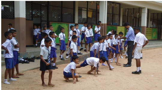
ශිෂ්‍යයන්ට තමන්ගේ ගැටලු සාකච්ඡා කිරීමට අවස්ථාව දීම