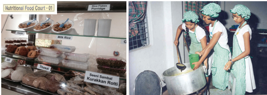
1.1 රූපය - සෞඛ්‍යවත් ආහාර සැපයීම

මෙවැනි ප්‍රතිපත්ති මගින් සෞඛ්‍යවත් පරිසරයක් ගොඩනැගීමට නම් එවන් ප්‍රතිපත්ති ගැන අධ්‍යාපන බලධාරීන්, විදුහල්පතිවරුන්, ගුරුවරුන්, දෙමව්පියන් සහ පාසල් සිසුන් යන සියලුම පාර්ශ්වකරුවන් දැනුවත් විය යුතු අතර ඒ පිළිබඳ එකඟතාවක් ද පැවතිය යුතු ය.