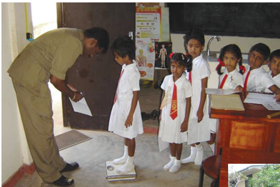
ශරීර ස්කන්ධ දර්ශකය