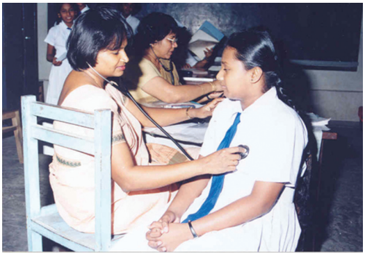
1.7 රූපය -වාර්ෂික පාසල් සනීපාරක්ෂක සමීක්ෂණය