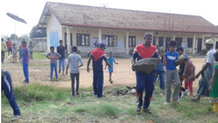
1.5 රූපය - ශ්‍රමදාන පැවැත්වීම

එමෙන්ම පාසල් සෞඛ්‍ය ප්‍රවර්ධනයට ප්‍රජා දායකත්වය ලබා ගත යුතු ය. උදාහරණයක් ලෙස පාසල් භූමිය තුළ ඇති විය හැකි අනතුරු අවම කර ගැනීමට ප්‍රජාව මගින් පාසලේ ශ්‍රමදාන පැවැත්වීම, පාසල් ක්‍රීඩා පිට්ටනිය සකසා දීම, පාසල් දරුවන් දුම්වැටි සහ මත්ද්‍රව්‍ය භාවිතයට යොමු වීම වැළැක්වීමට පාසල අවට එවන් ද්‍රව්‍ය අලෙවි කරන ස්ථාන අවම කිරීමට කටයුතු කිරීම වැනි ක්‍රියා මගින් ප්‍රජාවට පාසලේ සෞඛ්‍ය ප්‍රවර්ධනය සඳහා දායක විය හැකි ය.