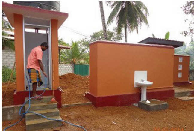
1.8 රූපය - සනීපාරක්ෂාවට අවශ්‍ය පහසුකම් සැපයීම

මීට අමතරව, මෙම සේවාවන්වල අඩු පාඩු ඇත්නම් ඒවා සැකසීම හා කාර්යක්ෂම කිරීම ද නව අවශ්‍යතා හඳුනා ගෙන නව සේවාවන් ක්‍රියාත්මක කිරීම ද මගින් සෞඛ්‍ය ප්‍රවර්ධනය සිදු කළ හැකි ය.