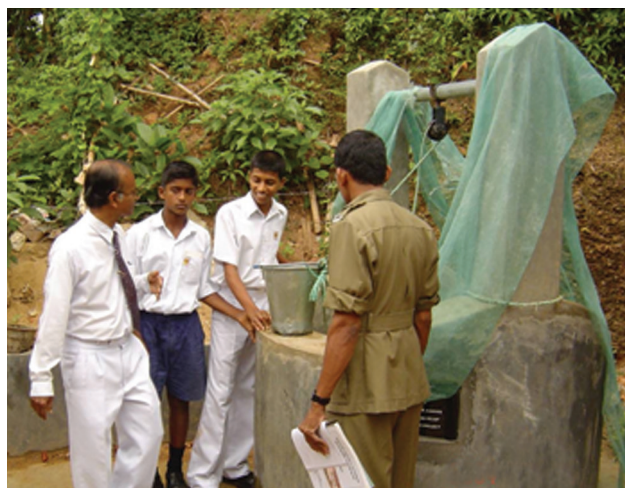
1.9 රූපය -සෞඛ්‍ය පහසුකම් පරීක්ෂා කිරීම