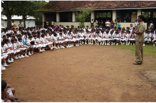
1.6 රූපය - වැඩමුළු මගින් සෞඛ්‍ය දැනුම ලබා දීම