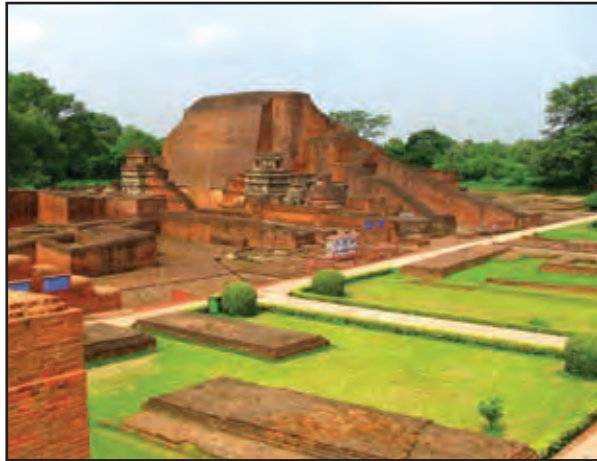
නාලන්දා විශ්වවිද්‍යාලයෙහි නටබුන්

අනුරාධපුර යුගයේ දී පිරිවෙන නමින් හඳුන්වන ලද භික්ෂු වාසස්ථාන විශාල ප්‍රමාණයක් පැවති අතර, මහා විහාරයට අනුබද්ධිත ආයතන ගණන සියයටත් වඩා වැඩි ය. තව ද එම යුගයේ ම රෝහණයේ නිස්ස මහා විහාරයට අනුබද්ධිත ව රුහුණු ප්‍රදේශය පුරා එවැනි භික්ෂු ආරාම සංකීර්ණ විශාල ප්‍රමාණයක් පිළිබඳ ව මහාවංසයෙහි තොරතුරු සඳහන් වේ.