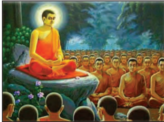
බුදුන් වහන්සේ ශ්‍රාවකයන්ට ධර්මය දේශනා කිරීම