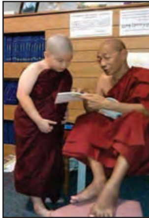
වනපොත් කරන සාමනේරයන් වහන්සේලා

කෝට්ටේ යුගයේ පැවති පිරිවෙන් අධ්‍යාපන තත්ත්වය පිළිබඳ තතු එවකට රචනා කරන ලද ගිරා සන්දේශයෙහි එන මෙම පද්‍යයෙන් පැහැදිලි වේ. මෙහි සඳහන් ව ඇත්තේ තොටගමුවේ විජයබා පිරිවෙණ පිළිබඳ ව ය.