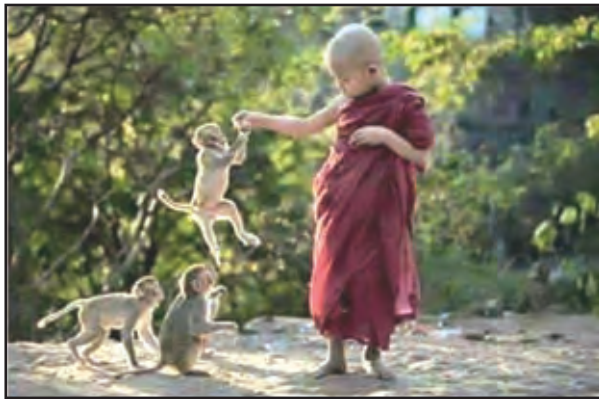
කෙළිදෙලෙන් ගත කරන සාමනේරයන් වහන්සේ

දේශීය සිසුන්ට අමතර ව විදේශීය සිසුන් ද මෙහි අධ්‍යාපනය ලබා ඇත. විදේශීය සිසුන්ගේ භාෂා මාධ්‍ය ලෙස සංස්කෘත, දෙමළ, මාගධී, පාලි වැනි මාධ්‍ය භාවිත විය. මෙසේ කෝට්ටේ පිරිවෙන්වල අධ්‍යාපනය ලැබීම සඳහා සිසුන් පැමිණි විදේශීය රටවල් ලෙස,