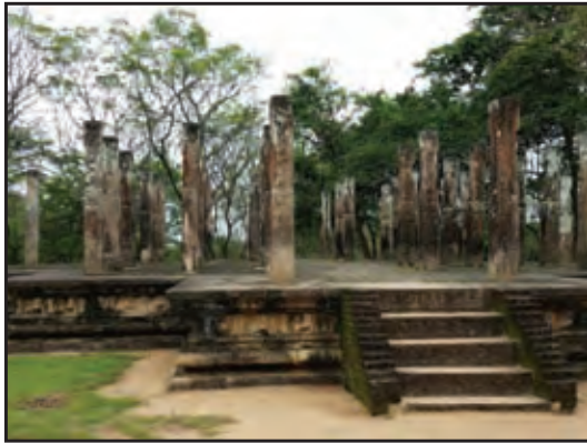
පොළොන්නරුව ආලාහන පිරිවෙන

අනුරාධපුර යුගයේ පැවති ඵෙරවාදී අධ්‍යාපනය ඒ අයුරින් ම පවත්වාගෙන යාමට පාලකයන් හා භික්ෂූන් වහන්සේ උත්සාහ දරා ඇත. පොළොන්නරු යුගයේ දක්නට ලැබෙන එක් විශේෂත්වයක් වන්නේ ඵෙරවාදී ආරාමික අධ්‍යාපනයට ලෞකික විෂය සම්මිශ්‍ර වීමයි. ඒ බව ගල්විහාර කපීකාවත තුළින් ගම්‍ය වේ.