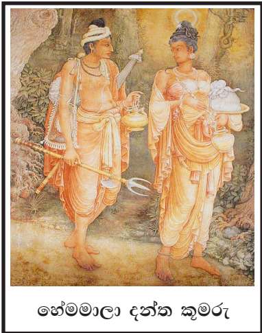
හේමමාලා දන්ත කුමරු

ශීල ප්‍රතිපත්තිය, දස රාජ ධර්ම, සතර සංග්‍රහ වස්තු පිළිපදිමින් ධාර්මික රාජ්‍ය පාලනයක් ගෙන ගියහ.