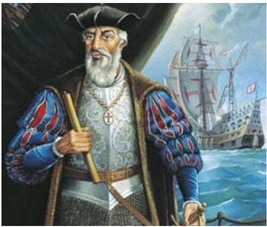
රූපය 2.2 වස්කෝද ගාමා

වස්කෝද ගාමා ඉන්දියාවේ කැලිකට් වරායට පැමිණ වැඩිකල් යාමට පෙර ලංකාව පිළිබඳ යම් අවබෝධයක් ලබා ගැනීමට පෘතුගීසීන්ට හැකියාව ලැබුණි. ලංකාවේ කුරුඳුවලට යුරෝපීය වෙළෙඳ පොළෙන් ඉහළ මිලක් ලැබෙන බවත් වෙනත් කුළබඩු බොහොමයක් මේ දූපතේ ඇති බවත් පෘතුගීසීන් විසින් අවබෝධ කර ගන්නා ලදී.