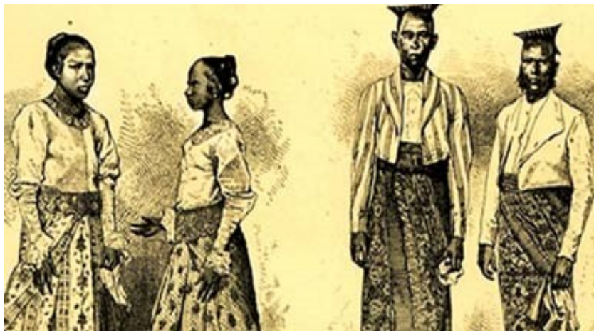
රූපය 2.4 පෘතුගීසීන්ගේ බලපෑමෙන් මෙරට ඇඳුම් පැලඳුම් වෙනස් වූ ආකාරය

මුහුදුබඩ ප්‍රදේශ පෘතුගීසී පාලනයට නතු වීමත් සමඟ එහි සමාජය හා සංස්කෘතියේ ද විවිධ බලපෑම් සිදුවිය. කතෝලික ජන සමාජය බිහිවීම ඉන් වැදගත්වන අතර පහත සඳහන් අංශවලට ද බලපෑම් එල්ල විය.