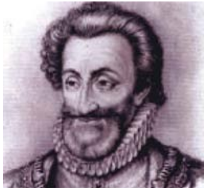
රූපය 2.1 නාවික හෙන්රි

එම සියවසේ පෘතුගාලයේ සිටි හෙන්රි කුමරු හෙවත් නාවික හෙන්රි දේශ ගවේෂණ ව්‍යාපාරයේ පුරෝගාමියා විය. මේ අනුව වස්කෝද ගාමා නමැති නාවිකයා අප්‍රිකාව වටා යාත්‍රා කොට 1498 වර්ෂයේ දී ඉන්දියාවේ කැලිකට් වරායට සේන්ද්‍ර විය. මෙයින් පසු ව යුරෝපා ජාතීන්ට ආසියාවේ දොරටු විවර විය. ඒ අනුව ලන්දේසි, ප්‍රංශ හා ඉංග්‍රීසි වැනි යුරෝපා ජාතිහු ආසියාවට පැමිණීමට සමත් වූහ.