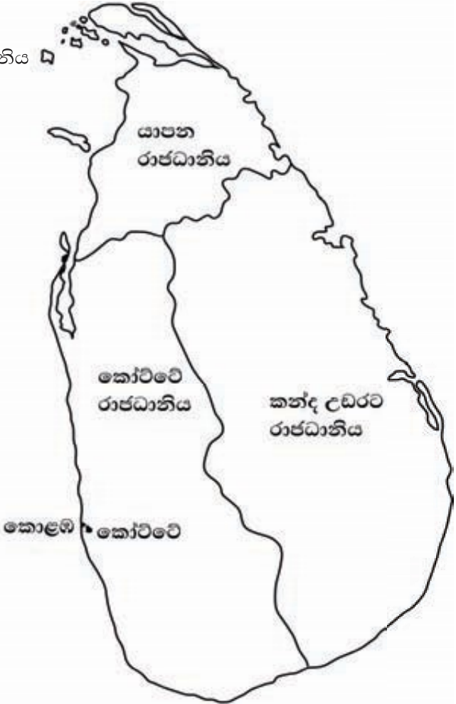
සිතියම 2.1 දහසය වන සියවසේ ලංකාවේ දේශපාලන බෙදීම

පෘතුගීසීන් ගොඩබසින විට අටවන වීරපරාක්‍රමබාහු රජු කෝට්ටේ පාලකයා විය. යාපනය රාජධානියේ පාලකයා වශයෙන් පරරාජසේකරම් රජු කටයුතු කළ අතර උඩරට රාජධානියේ පාලකයා ලෙස සේනාසම්මත වික්‍රමබාහු කටයුතු කරමින් සිටියේ ය. මීට අමතරව පැරණි රජරටට අයත් ව තිබූ වනගත ප්‍රදේශ වන්නී පාලකයන් යටතේ පැවතිණි. 1521 වන විට කෝට්ටේ රාජ්‍යය තවදුරටත් බෙදී ගියේ ය.