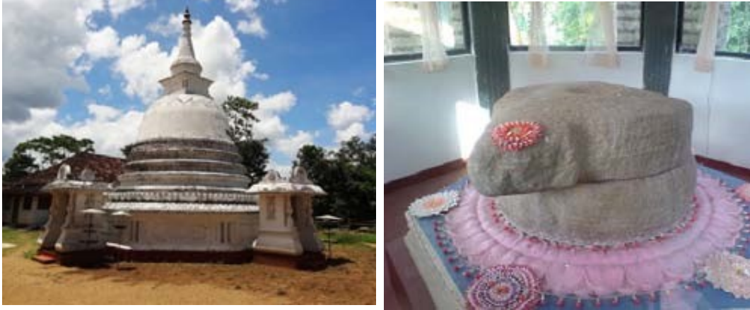
රූපය 2.3 දෙල්ගමුව විහාරය හා දළදාව සඟවා තිබූ එහි කුරහන් ගල

බුවනෙකබාහු රජුගේ මරණින් පසුව පෘතුගීසිහු ළාබාල විශේෂ පසු වූ ධර්මපාල කුමරු කෝට්ටේ පාලකයා බවට පත් කර තම සිතැඟි පරිදි කටයුතු කිරීමට උත්සාහ දැරූහ. පෘතුගීසින්ගේ බසට අවනතව කටයුතු කළ රජ කතෝලික ආගම වැළඳගෙන දොන් ජුවන් ධර්මපාල නමින් බෞතීස්ම ලැබී ය. තම රජු කතෝලික ආගම වැළඳ ගැනීම ගැන කළකිරුණු කෝට්ටේ වැසියෝ සිතාවක රාජ්‍යය වටා එක් වූහ. කෝට්ටේ දළදා මැදුරේ තැන්පත් කර තිබූ දළදා වහන්සේ හිරිපිටියේ නිලමේ විසින් සිතාවකට වැඩම කර දෙල්ගමුව විහාරයේ කුරහන් ගලේ සඟවා තබන ලදී. ඉන් පසුව හික්ෂුන් වහන්සේලාගේ සහාය ද සිතාවක රාජ්‍යයට හිමි විය. ධර්මපාල කුමරුගේ පියා වූ විදිය බණ්ඩාර පෘතුගීසින්ට එරෙහිව කැරලි ගැසී ය. මෙම දේශපාලන පසුබිම මත සිතාවක බලවත් රාජ්‍යයක් ලෙස මතු වී ආවේ ය.