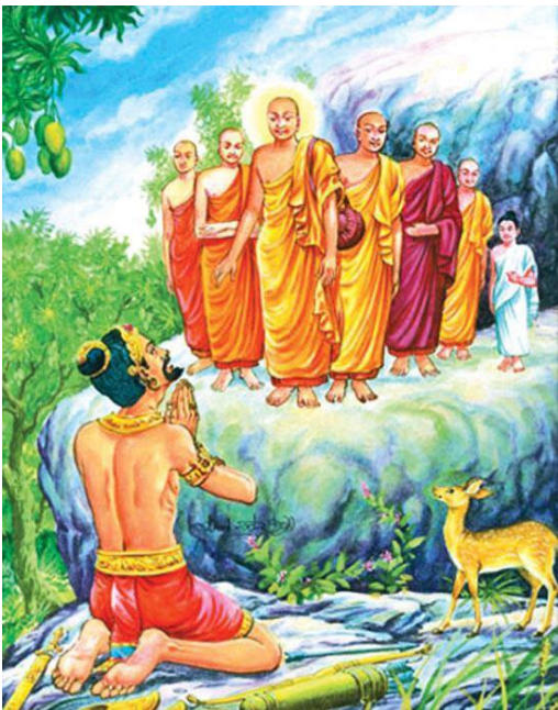
3.4 රූපය-දෙවනපෑතිස් මිහිඳු හිමියන් හමුවේ

වේදිසාවට ගියේ ඔවුන් දැක බලා ගැනීමට ය. අනතුරුව උන්වහන්සේ සමඟ ඉට්ඨිය, උත්තිය, සම්බල, හද්දසාල, සුමන සාමනේර සහ භණ්ඩුක උපාසක යන පිරිස පොසොන් පොහොය දවස මිහින්තලයට සැපත් වූහ. විනය කර්ම කිරීමට උපසපන් හික්ෂුන් හතර නමක් ද මෙරට ජනයාට පැවිද්ද හා උපසම්පදාව හඳුන්වාදීමට සාමනේර නමක් හා උපාසකයෙකු ද මිහිඳු හිමියන් විසින් කැඳවාගෙන ආ බව ඉන් පැහැදිලි වේ. සුමන සාමනේරයන් ගිහිකල සංඝමිත්තාවන්ගේ පුත්‍රයා ය. භණ්ඩුක උපාසක වේදිසා දේවියගේ නැගණියගේ පුත්‍රයා ය.