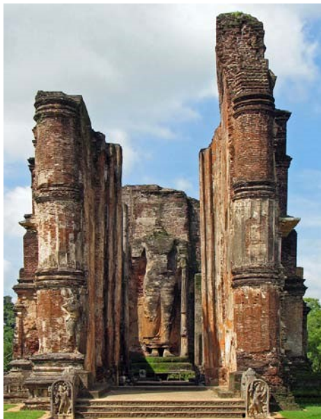
5.13 රූපය-ලංකාතිලක පිළිමගෙය

හෙවත් තිවංක පිළිමගෙය අනෙක් නිර්මාණය වේ. ථූපාරාමයෙහි හිඳි පිළිමයක් හා අනෙක් විහාර දෙකෙහි හිටි පිළිම ද දක්නට ලැබේ.