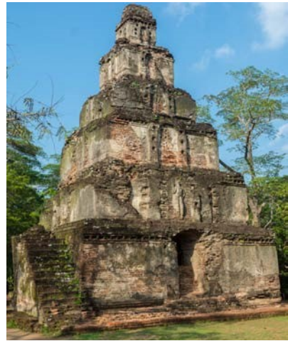
5.18 රූපය-සත්මහල් ප්‍රාසාදය

ආලාහන පිරිවෙන් භූමියේ පිහිටි කිරිවෙහෙර පොළොන්නරු යුගයේ සුවිශාල ස්තූප අතර ඉතා වැදගත් ය.