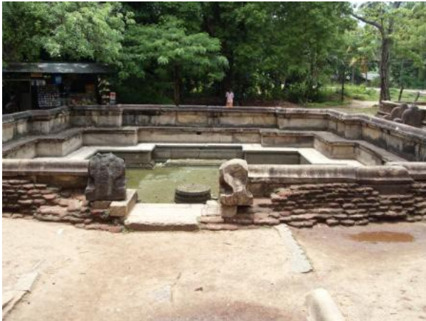
5.11 රූපය-පොළොන්නරුවේ කුමාර පොකුණ

කොටා ඇති සෙල්ලිපිවල සඳහන් වේ. ඔවුන් දැරූ තනතුරු ද ඒවායේ සඳහන් වේ.