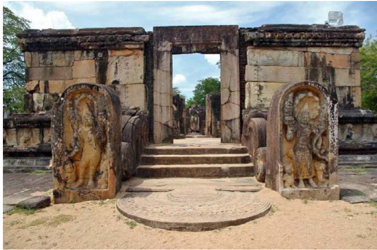
5.14 රූපය-පොළොන්නරුව හැටදාගෙය

මෙම ප්‍රතිමා ගෘහවල බිත්ති ඉතා සනව තනා තිබෙන නිසා විහාර මන්දිරය තුළ ඇති ඉඩකඩ සීමිතය. මේවාහි බුදු පිළිම තැන්පත් කර ඇති ගර්භ ගෘහයට ආලෝක ලබා ගැනීමට පොළු සහිත පටු කවුළු තබා ඇත.