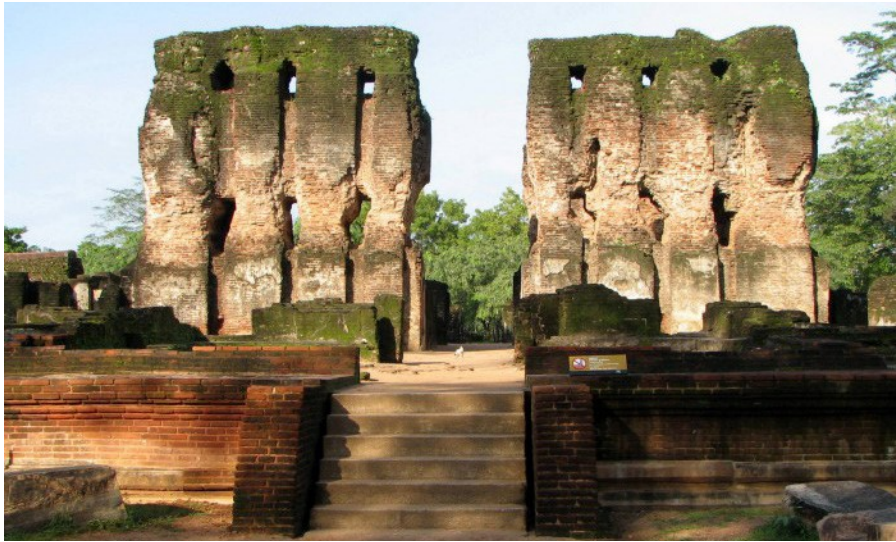
5.6 රූපය-මහා පරාක්‍රමබාහු රජ මාලිගාව

මෙම ශාසනික කටයුත්ත පොළොන්නරු කතිකාවතේ සඳහන්වන අතර එය ගල්විහාරයේ පර්වත බිත්තියේ කොටා ඇත. එය ගල්විහාර ලිපිය නමින් ද හැඳින්වේ.