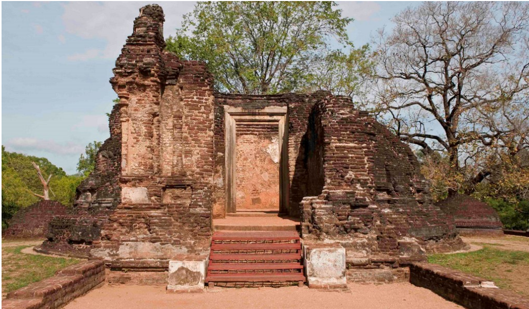
5.15 රූපය-පොත් ගුල් විහාරය

පරාක්‍රම සමුද්‍රයේ වැව් බැම්ම කෙළවර පිහිටා ඇති පොත්ගුල් විහාරය නමැති ගොඩනැගිල්ල ද මේ යුගයේ විශේෂ නිර්මාණයකි. අඩි 157 ක වට ප්‍රමාණයක් ඇති වෘත්තාකාර පාදමක් මත සම උසට නංවන ලද බිත්ති මත රැඳ වූ ලී වහලක් මෙහි තිබෙන්නට ඇත. මෙය පරාක්‍රමබාහු රජුගේ දෙවන බිසව වූ චන්ද්‍රාවතී විසින් කරවන ලද බව එම ස්ථානයෙන් ලැබුණු සෙල්ලිපියක සඳහන් වන බව ඉතිහාසඥයෝ පෙන්වා දෙති.