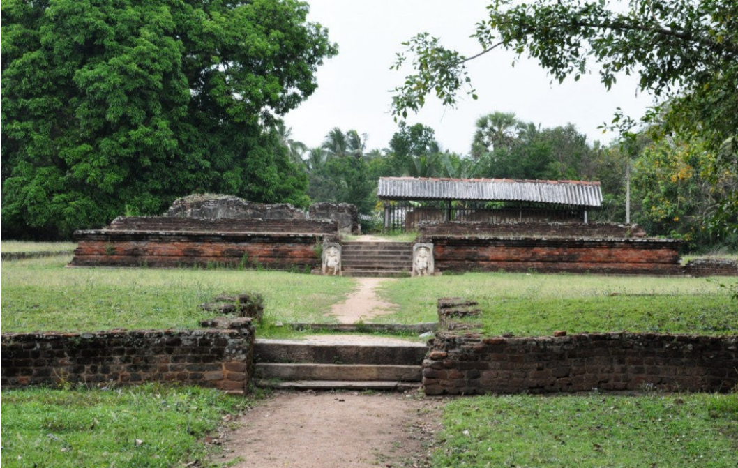
5.4 රූපය-විජයබාහු රජු අනුරාධපුරයේ ඉදි කළ මාලිගාවේ නටබුන්

මේ කටයුතුවල නිරත වී සිටි මුල් යුගයේ දී ඡත්තග්ගාහකනාථ, ධම්මගේහනාථ සහ සෙට්ඨිනාථ යන රජයේ උගත් තනතුරු දැරූ සහෝදරයන් තිදෙනෙකු ඉන්දියාවට ගොස් කලක් එහි වාසය කොට නැවත පැමිණ 1074 දී පමණ රුහුණේ හා දක්බිණ දේශයේ කැරැල්ලක් ඇති කළ ද රජුගේ හමුදා ඒවා මර්දනය කළහ.