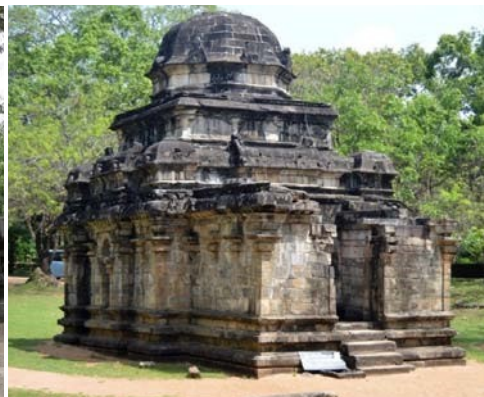
5.2 රූපය-අංක 02 ශිව දේවාලය