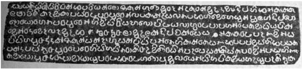
5.3 රූපය-පනාකඩුව තඹ සන්නස