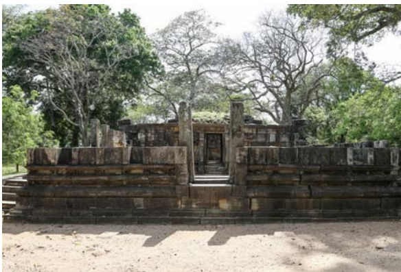
5.1 රූපය-අංක 01 ශිව දේවාලය

මේ අවධියේ චෝළයෝ පොළොන්නරුව හා ඒ අවට ප්‍රදේශවල කෝවිල් ඉදි කළහ. පොළොන්නරු පූජා භූමියේ දැනට හඳුනාගෙන ඇති අංක 2 ශිව දේවාලය අංක 01 ශිව දේවාලය උදාහරණ වේ.