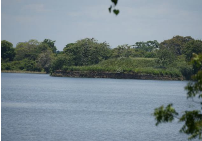
5.9 රූපය-පරාක්‍රම සමුද්‍රය

පරාක්‍රම සමුද්‍රයට අමතරව පරාක්‍රම තටාක, මහින්ද තටාක ආදී වැව් ද අභිනවයෙන් එකුමා විසින් කරවන ලද බව සඳහන් වේ. අලුත් වැඩියා කර වූ වැව් අතර මීන්නේරි වැව, කවුඩුලු වැව, කලා වැව, මහකනදරා වැව, පදවිය වැව, යෝධ වැව, ආදී වැව් රාශියක් ම වේ. කලාවැවේ සිට අනුරාධපුරයේ තිසා වැවට ජලය ගෙන ගිය කි. මී. 86 දිග ජය ගඟ ද (යෝධ ඇළ) මේ රජතුමා විසින් අලුත්වැඩියා කරවනු ලැබීය.