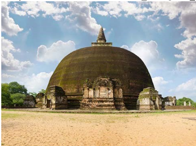
5.16 රූපය-රන්කොත් වෙහෙර

ස්තූප නිර්මාණ කලාව ද පොළොන්නරු යුගයේ ප්‍රවලිතව පැවතුණි. ස්තූප තැනීමේදී ඇත අනුරාධපුර යුගයේ ස්තූප සැලැස්ම අනුගමනය කළ පොළොන්නරු යුගයේ ශිල්පීහු ජේසා වළලු සහිත වේදිකාවක් මත සුවිශාල ගර්භගෘහයක් සහිත ස්තූප තැනූහ.