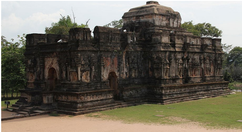
5.12 රූපය-තිවංක පිළිමගෙය

පොළොන්නරු යුගයේ සිංහල වාස්තු විද්‍යාඥයින් තැන වූ ඉතා උසස් නිර්මාණ වන්නේ ගඩොල්මුවා බොකු වහල සහිත පිළිම ගෙවල් බව පරණවිතාන මහතාගේ මතය යි. මෙවැනි විහාර මන්දිර තුනක් පොළොන්නරුවේ ඇත. එය දැනට හොඳින් ආරක්ෂා වී පවතින ගොඩනැගිල්ල ථූපාරාමය යි. මහා පරාක්‍රමබාහු රජුගේ මහින්ද ඇමතියා විසින් තැනවූවකි. මෙම නිර්මාණ වර්ගයේ වැදගත්ම නිර්මාණය ලංකාතිලකය වේ. එය මහා පරාක්‍රමබාහු රජු තැනවූවකි. ජේතවන විහාර සංකීර්ණයේ පිහිටි තිවංක පටිමාසරය