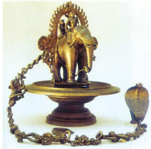
5.5 රූපය-ඇත් පහන

පරාක්‍රමබාහු මානාභරණගේ සහ රත්නාවලී කුමරියගේ පුත් කුමාරයා විය. ඔහුගේ උපන්ගම ලෙස මහාවංසයෙහි සඳහන් කර තිබෙනුයේ දක්ඛිණ දේශයේ පුංඤගාමය වේ. වර්තමාන කෑගලු දිස්ත්‍රික්කයේ දැදිගම වශයෙන් එම ස්ථානය හඳුනාගෙන තිබේ. දැදිගම කොටවෙහෙර කැනීමේ දී පරාක්‍රමබාහු කුමාරයා උපන් තැන ගොඩනගන ලදැයි සැලකෙන සුනිසර නම් කුඩා වෛතාසය හමු වී තිබේ. එම ස්තූපයේ තිබී හමු වී දැනට කොළඹ කෞතුකාගාරයේ තැන්පත් කර ඇති ඇත් පහන සුවිශේෂ වූ ලෝකඩ කලා නිපැයුමකි.