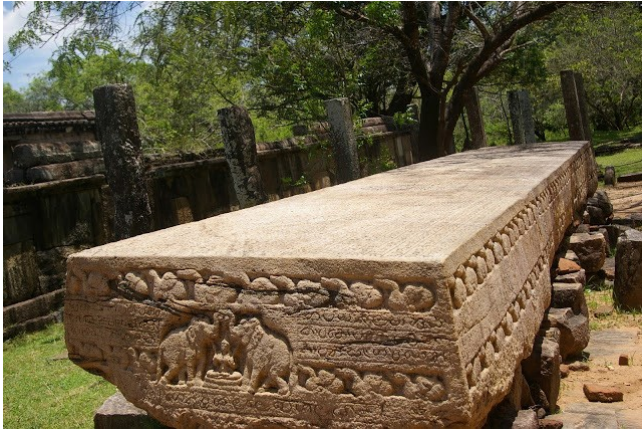
5.8 රූපය-ගල්පොක ශිලා ලේඛනය

මහා පරාක්‍රමබාහු රජතුමාගෙන් අනතුරුව පොළොන්නරුවේ රජකම දැරූ පාලකයන් අතුරින් කැපී පෙනෙන පාලකයෙකු වූයේ නිශ්ශංකමල්ල රජතුමා ය. පරාක්‍රමබාහුගෙන් පසුව බලයට පත් වූයේ දෙවන විජයබාහු නමැත්තෙකි.