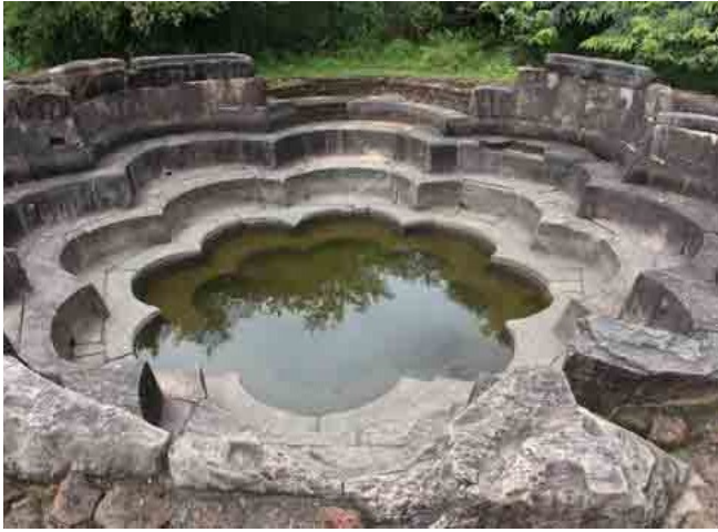
5.17 රූපය-නෙළුම් පොකුණ