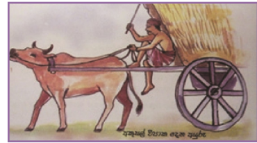
(ධම්ම පදය - යමක වග්ගය 1-2 ගාථා)

දූෂිත චේතනාවෙන් කරන ලද අකුසල කර්මයෙහි විපාක ගවයා පසු පස එන රියසක මෙන් දුක් දෙමින් ලුහුබැඳ එයි. පහත් චේතනාවෙන් කරන ලද කුසල කර්මයෙහි විපාකය අත්නොහැර සිටින සෙවනැල්ල මෙන් ලුහුබැඳ එයි.