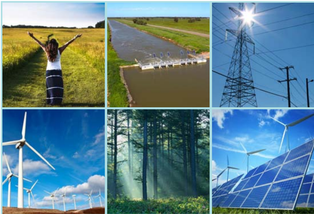
7.4 රූපය : මිනිසා පරිසරය ප්‍රයෝජනයට ගන්නා විවිධ ක්‍රම

මිනිසා තම ආර්ථික, සමාජීය, දේශපාලන හා සංස්කෘතික ආදි විවිධ කටයුතු සපුරා ගැනීම සඳහා භෞතික පරිසරය ප්‍රයෝජනයට ගන්නා බව මේ අනුව පැහැදිලි වේ (7.4 රූපය).