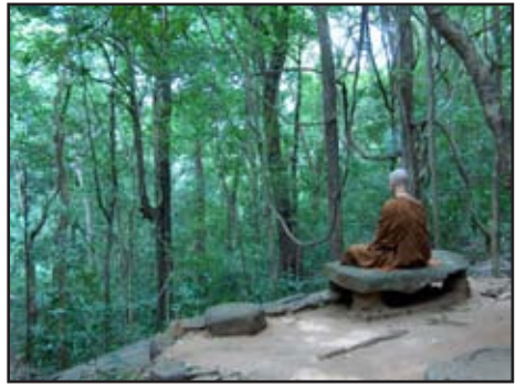
7.6 රූපය :