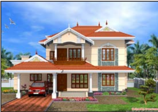
7.3 රූපය : පරිසරය වෙනස් කරමින් මිනිසා පරිසරය ප්‍රයෝජනයට ගෙන ඇති අවස්ථා