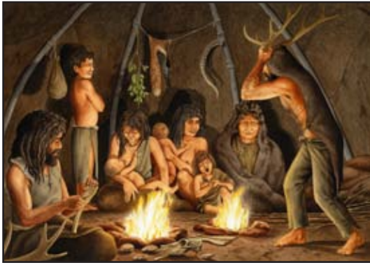
7.1 රූපය : පරිසරය පවතින ආකාරයෙන් ම ප්‍රයෝජනයට ගැනීම