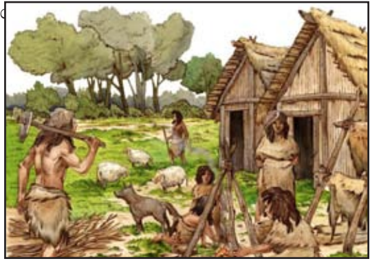
7.2 රූපය : පරිසරය සමග සහයෝගයෙන් ක්‍රියා කිරීම