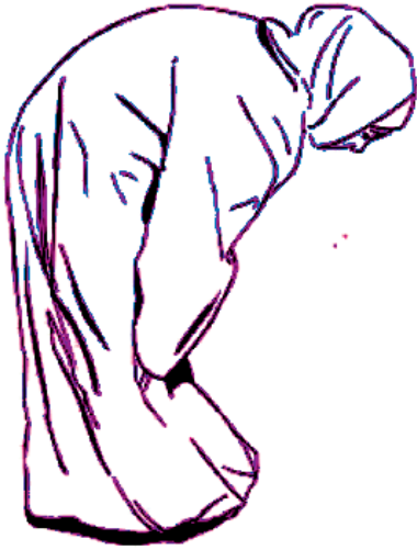
නැමෙමින් රැකුළු කරන්නේ ය.