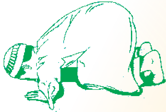
හිස බිම තබමින් සුජුද්ද් කරන්නේ ය.

සුරතුවේ ආරාධනා, අත්තහිටියාත් යනාදිය වැදගත් පාරායණයන් වේ.