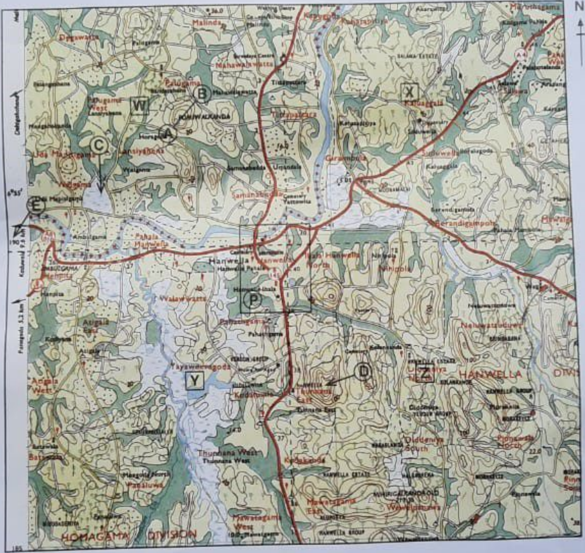
SCALE : 1 : 50,000