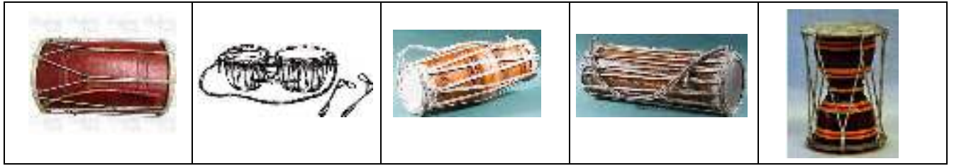
A B C D E